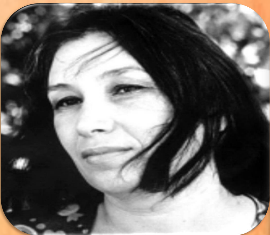
נעמי שמר ז"ל

לדודו ברק יש זיקה לירושלים ולמקורות, בהשראת ילדותו, דבר הבא לידי ביטוי בשירים רבים שכתב, המיוחסים לשירת התפילה, ביניהם: 'הושענא' ו'הללויה שבת שלום'.