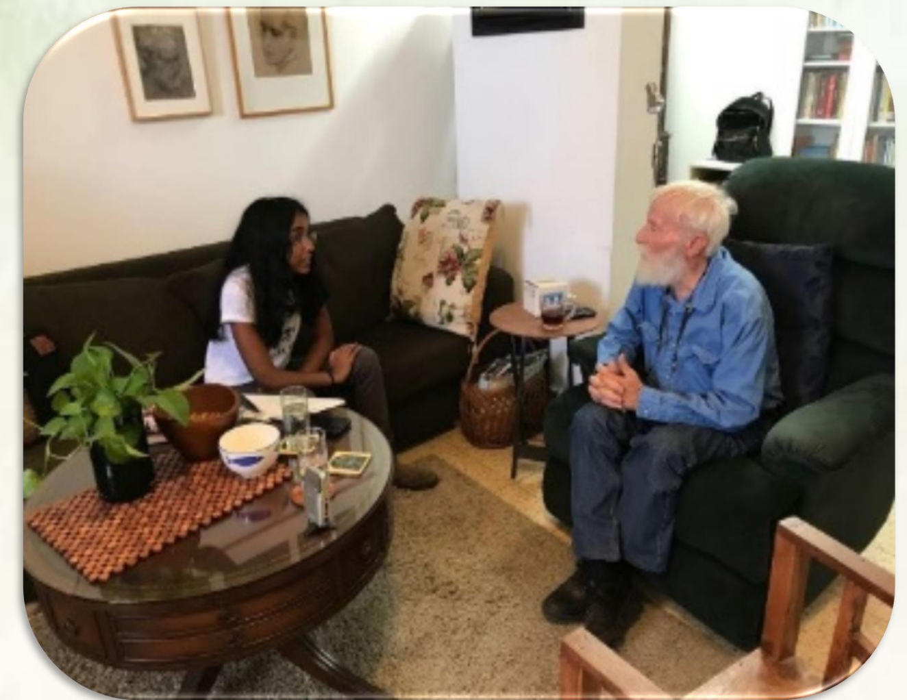
ריאיון עם הפזמונאי יורם טהרלב

דודו ברק נולד וגדל בירושלים. תמונות הנוף, חוויות הילדות בעיר והטיולים בסביבתה, מתוארות בשירים רבים שכתב וביניהם: 'דרך ארץ השקד', 'שובי בת ירושלים', 'כותל בירושלים' ו'ארץ ישראל יפה'.