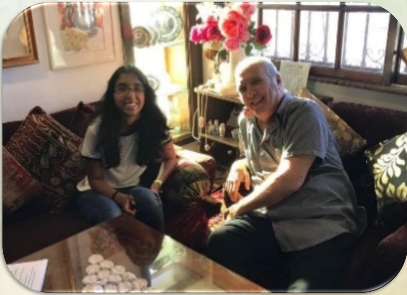
ריאיון עם הפזמונאי דודו ברק